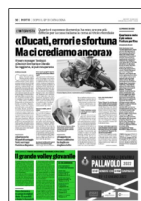
Superficie 12 %

ARTICOLO NON CEDIBILE AD ALTRI AD USO ESCLUSIVO DEL CLIENTE CHE LO RICEVE - 4 - L.1799 - T.1799